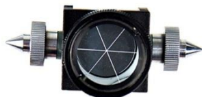
Vytyčovací hranol s bublinou – 2 900,- Kč