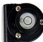
Příložná libela – 190,- Kč