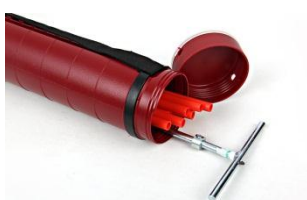
Startovací sada GEOBRČKO – 820,- Kč (tubus, zarážec, 40 ks geobrček 80cm)