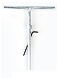
Zarážec univerzální – 290,- Kč